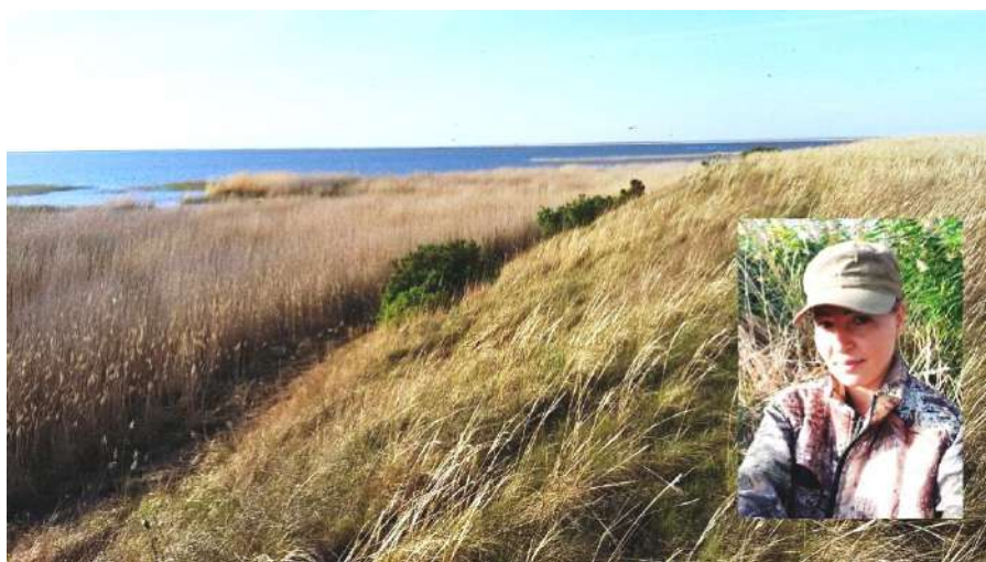
«На Генеральском острове». (Фото краеведа Яны Ванжи, май 2019 г.)