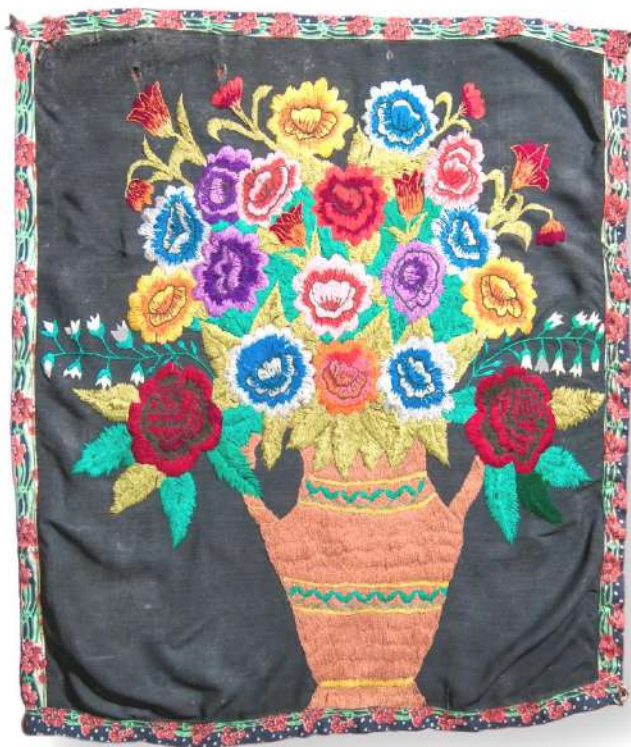
Панно настенное. "Розы в вазе" Автор – М. К. Нагель (Моор). 50-е гг. XX века. Штапель, нить мулине, х/б чулочная нить, ручная вышивка - гладь, стебельчатый шов. П.Апановка, Тарановский район, Кустанайская область. Подарено музею в 1995 году. Фонд ЛМИК.