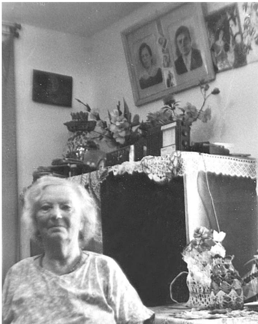
М. И. Лефинг. П. Апановка, Кустанайская область. 1995 г.