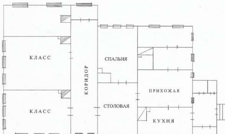
ПЛАН ДАМБАРСКОЙ ВОЛОСТНОЙ ШКОЛЫ