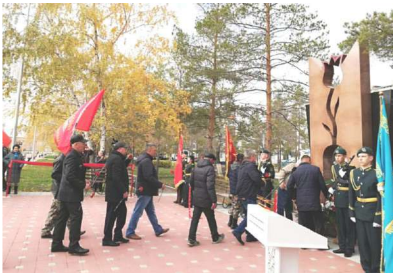
Открытие Обелиска памяти воинам-интернационалистам. Лисаковск, 17 октября 2019 г.