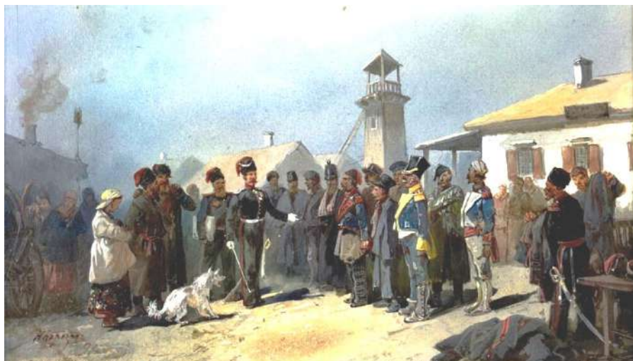
Картина «Зачисление в казаки пленных поляков из армии Наполеона атаманом Ф. Набоковым». Автор – Н. Каразин