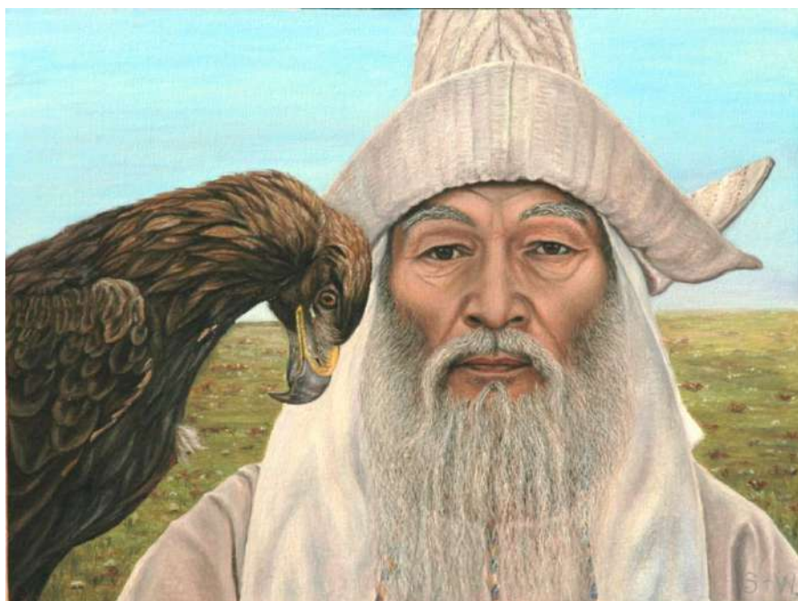
Картина «Владыка Степи», автор – В. Сейтбаталов