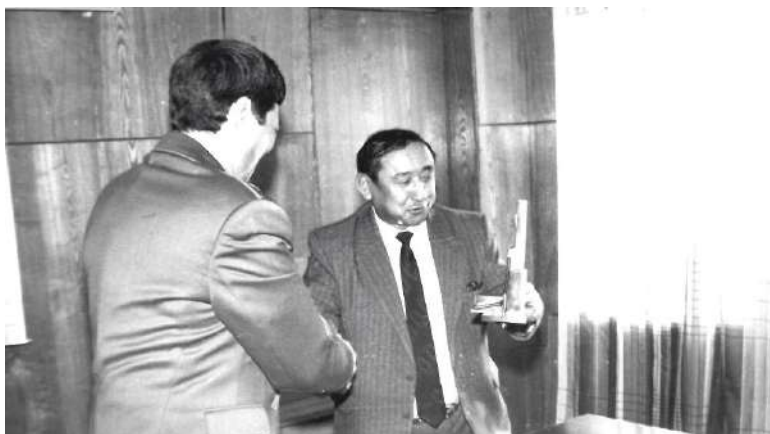
Визит в Лисаковск первого казахстанского космонавта Т. Аубакирова. Памятный сувенир от Лисаковской свободной экономической зоны Т. Аубакирову вручает первый заместитель главы городской администрации О. Х. Айдосов. 1992 г.